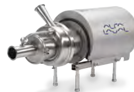
Alfa Laval LKH Prime UltraPure

Najnowsze pompy w typoszeregu najlepiej sprzedających się higienicznych pomp premium Alfa Laval.