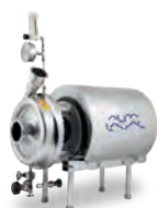
Alfa Laval LKH UltraPure