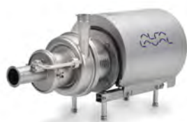
Alfa Laval LKH Prime

Alfa Laval LKH Prime UltraPure jest dostępna z kompletnym pakietem dokumentacji Alfa Laval Q-doc, spełniając wymagania stawiane przez przemysł farmaceutyczny.